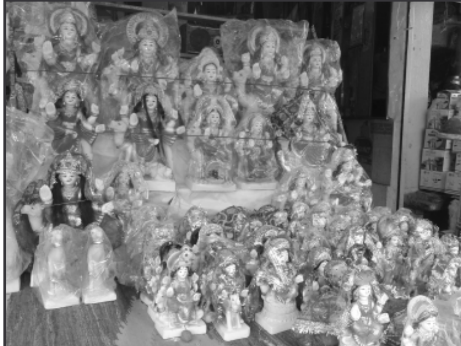
મા દશામાના વ્રતના દિવસો નજીક આવતા જ પાલનપુર શહેરના અનેક વિસ્તારમાં રંગબેરંગી શણગારેલી દશા માતાની મૂર્તિઓએ આકર્ષણ જમાવ્યું છે. શહેરના સિમલાગેટ, દિલ્હીગેટ, સ્ટેશન રોડ સહિતના વિસ્તારમાં મૂર્તિઓ અને પૂજા-વિધિની સામગ્રીની ખરીદીને લઈ મહિલાની ભારે ભીડ ઉમટી રહી છે. (હરેશ જી. જોષી)