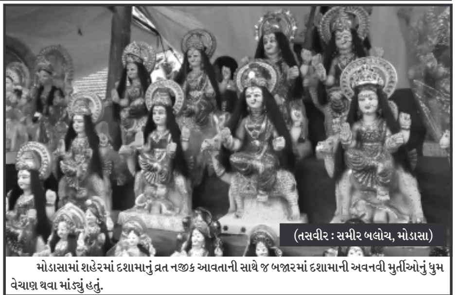
મોડાસામાં શહેરમાં દશામાનું વ્રત નજીક આવતાની સાથે જ બજારમાં દશામાની અવનવી મુર્તિઓનું ધુમ વેસાણ થવા માંડ્યું હતું.