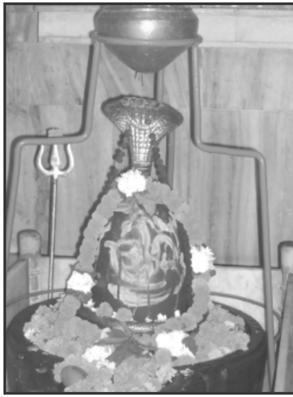
શ્રદ્ધાળુઓ પૂજા-અર્ચના કરવામાં લાગી જાય છે. નગર સહિત જિલ્લાના અનેક શિવાલયોમાં મહામૃત્યુંજય જાપના મંત્રો કષ્ટપ્રિય ભગવાન શિવ વૈદિક દેવતા છે અને તેમને વેદોમાં યજુર્વેદ સૌથી વધુ પ્રિય છે એટલે જ શ્રદ્ધાળુ યજુર્વેદીય રૂઢાધ્યાયથી ભગવાન શંકરનું

આ ઉપરાંત વાવોલના સિદ્ધનાથ મહાદેવ પાતે શિવ મહાપુરાણ કથાનું આયોજન કરવામાં આવ્યું છે. શિવજીને બિલીપત્ર ચઢાવવાનું વિશેષ મહત્વ હોવાથી આ માસમાં બિલિપત્રોની માંગમાં ખૂબ વધારો