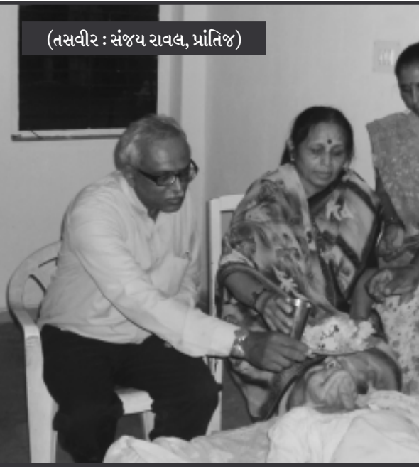
પ્રાંતિજ, તા. ૨૬ સાબરકાંઠા જિલ્લાના પ્રાંતિજ ખાતે નેશનલ હાઈવે નં. ૮ પર આવેલ તીથાગન વિસામો વૃદ્ધાશ્રમમાં

વૃદ્ધાશ્રમના સંચાલકોએ ૭૫ વર્ષીય વૃદ્ધાનું અવસાન થતાં તેમની અંતિમ ઈચ્છા પ્રમાણે ચક્ષુદાન-દેહદાન કરાવ્યું