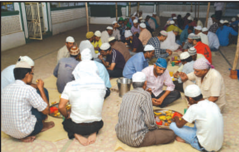
મુસ્લિમ બિરાદરોના ઈબાદત માટેના પવિત્ર રમઝાન માસની શરૂઆત થતા પાટનગરમાં પણ મુસ્લિમ ભાઈ-બહેનો અને બાળકો રોજા રાખી શ્રધ્ધાપૂર્વક ચૂસતપણે ઈબાદત કરતા અલગ જ માહોલ નજરે પડે છે. શહેરના મુસ્લિમો વહેલી સવારે ૪ કલાકે શહેરી કરી દિવસ દરમિયાન તકવા પરેજી સાથે રોજા કરી સાંજે ૭ કલાકે ઈફતાર સમયે રોજા છોડતા હોય છે. નમાઝ સમયે સે-૨ ૧ મસ્જિદમાં મુસ્લિમ ભાઈઓ નમાઝ અદા કરતા જોવા મળે છે.

ફોરલેન કરવાની મંજૂરી વિભાગ કક્ષાએથી આપી દેવાઈ છે. જેથી આગામી દિવસોમાં ૮ કી મી નો આ રસ્તો પણ ફોરલેન કરવાનું કામ હાથ ધરાશે. વિભાગ કક્ષાએથી આ કામગીરી સંદર્ભે સંધ્યાતિક મંજૂરી આપી દેવાઈ છે. વિજાપુર સુધીના રસ્તાને ફોરલેન કરવા પાછળ રૂપિયા ૮ કરોડનો ખર્ચ થશે. પેથાપુર મહુડી માર્ગનું કામ પુરુ થતા હજુ બે મહિનાનો સમય લાગશે. જ્યારે આગળ પણ રસ્તાના કામને મંજૂરી આપી દેવાતા દુકામો કામ શરૂ કરી દેવાશે. જેના લીધે આ માર્ગ પર રોડ સેફ્ટીના મામલે સુરક્ષિત ચિત્ર ઉભુ થશે. પવિત્ર યાત્રાધામ મહુડીના લીધે આ વિસ્તારમાં વાહનોની અવર જવર વિશેષ રહેતી હોવાથી વધતા ટ્રાફિકના ભારણને ધ્યાને લઈ પ્રાજેક્ટને આગળ ધપાવવામાં આવ્યો છે.