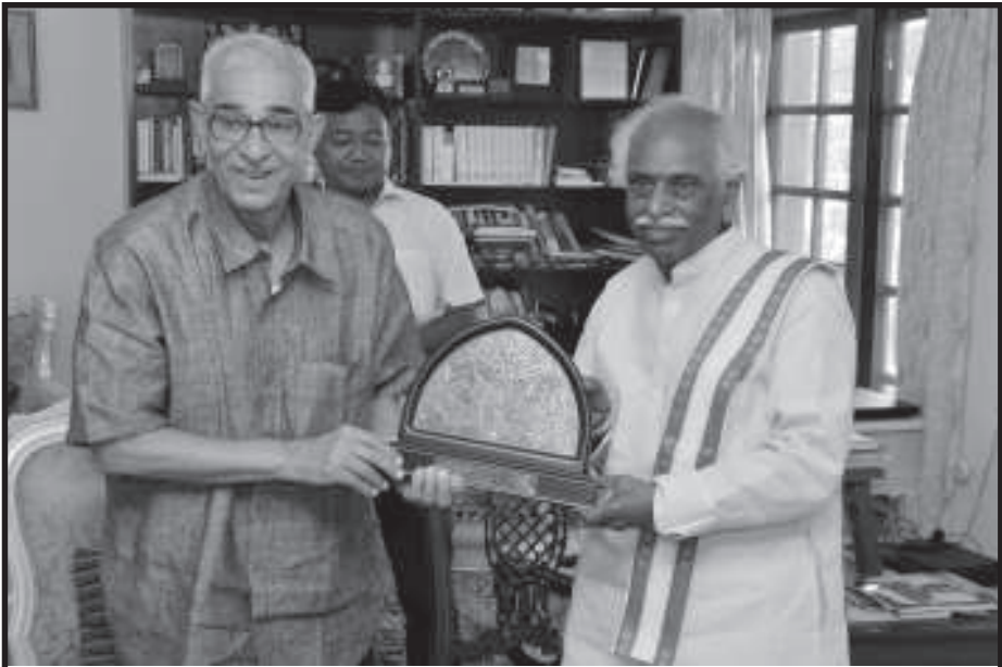
કેન્દ્રીય રાજ્યમંત્રી બંડારુ દત્તાત્રેય રાજ્યપાલશ્રીની શુભેચ્છા મુલાકાતે કેન્દ્રીય શ્રમ અને રોજગાર રાજ્યમંત્રી શ્રી બંડારુ દત્તાત્રેયે આજે રાજભવન ખાતે ગુજરાતના રાજ્યપાલ શ્રી ઓ.પી. કોહલીની શુભેચ્છા મુલાકાત લીધી હતી. આ મુલાકાત સમયે ઉચ્ચાધિકારીઓ પણ ઉપસ્થિત રહ્યા હતાં.