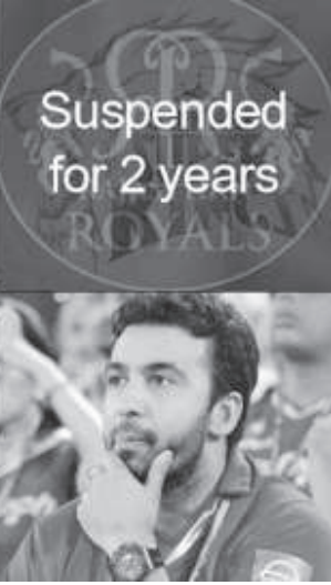
સામેલ હોવા બદલ દોષિત ઠેરવ્યા