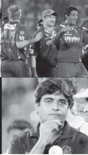
તપાસ માટે બનાવવામાં આવેલી

આર રવિન્દ્રનવાળી એક કમિટિની રચના કરી હતી. આઈપીએલ સડાબાજી અને મેચ ફિક્સિંગની