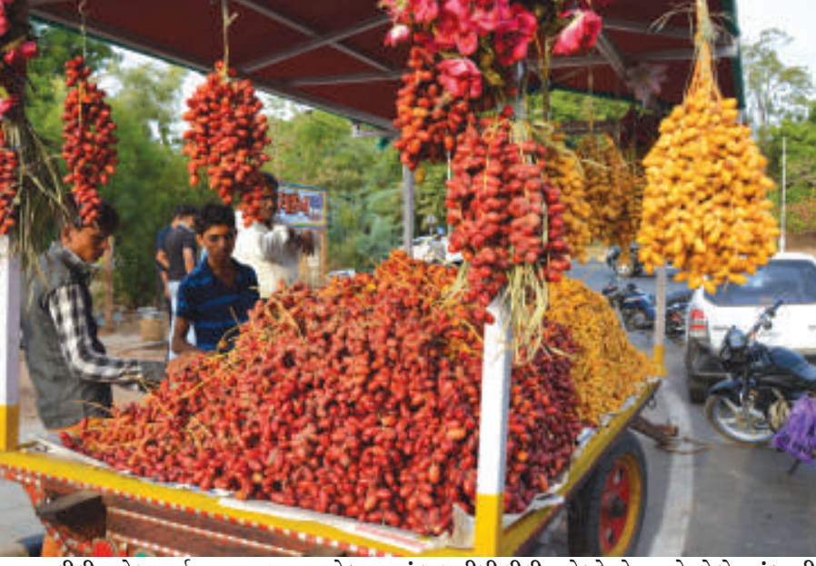
લીલી ખારેક - વર્ષાઋતુના આગમન સાથે બજારમાં લાલ-પીળી લીલી ખારેક ઠેર ઠેર નજરે પડે છે... તંદુરસ્તી માટે ખૂબ જ અસરકારક ગણાતું આ નાનકડું ફળ મધ્યવર્ગીય સમાજ માટે ઉપકારક છે... ખારેક સુકવેલી પણ પોષક છે પરંતુ સુકવેલ કરતા લીલી ખારેક હેમોગ્લોબિન માટે ખૂબ જ અકસીર છે... કચ્છની ખારેક સમગ્ર રાજ્યમાં વખણાય છે... આજકાલ ગાંધીનગર સહિત મહાનગરોમાં ઠેર ઠેર ખારેકનું વેચાણ પૂરબહાર ચાલે છે....

વિરહની વેદનામાં કવિએ લખેલું કાવ્ય છે. પ્રેમી હૈયાઓને વ્યાકુળ કરી નાંખે એવો વિરહ અષાઢમાં જ અનુભવવાય છે તો સવાલ થાય કે અષાઢ માસમાં એવું તો શું છે? એવો સવાલ થાય તો જવાબ એ છે કે અષાઢ માસમાં શું નથી? એમાં ભક્તિ છે, ઉજવણી છે, પ્રેમ છે અને વિરહ પણ છે. વરસાદમાં ન્હાવાની મગા છે