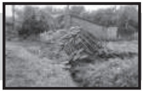
અરવલ્લી જિલ્લામાં ગાજવીજ સાથે વાવણીલાયક વરસાદ