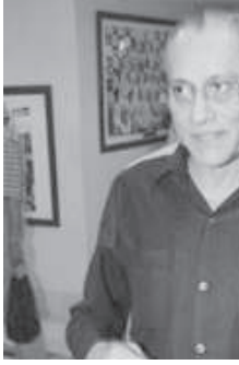
કારોબારી સમિતિની બેઠક બોલાવવામાં આવી હતી.

થાય સુધી હોદ્દાથી દૂર રહેશે. આજે યોજાયેલી બેઠકમાં તમામ પાસાઓ ઉપર ચર્ચા વિચારણા કરવામાં આવી હતી. આજે ચેન્નઈમાં ભારે સસ્પેન્સની સ્થિતિ વચ્ચે તક્રીદની