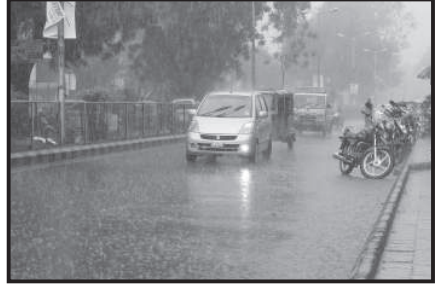
કોમરં છ રસ્તાથી સ્વસ્તિક ચાર રસ્તા જતાં લીબટી ઉપલેટામાં પડ્યો હતો. જ્યારે બનાસકાંઠા, દાહોદ, કચ્છ, પાટણ, મહેસાણા અને પંચમહાલ જિલ્લામાં

અમદાવાદ, તા. ૧૦ અમદાવાદ સહિત રાજ્યમાં આજે ઠેર ઠેર વરસાદ પડતાં ખેડૂતો સહિત નાગરિકો ખુશીથી ઝુમી ઉઠ્યા હતા. રાજ્યમાં આજે સૌરાષ્ટ્ર, દક્ષિણ ગુજરાત, મધ્ય ગુજરાતમાં ભારે વરસાદ પડ્યો હતો. અમરેલીના વડીયામાં ૫૨ મીમી, આણંદના સોજીયામાં ૮૬ મીમી, ભાવનગર તાલુકામાં ૫૫ મીમી, ભરૂચના જંબુસરમાં ૫૧ મીમી, પોરબંદરના કુતીયાણામાં ૫૩ મીમી, રાજકોટના મોરબીમાં ૬૦ મીમી, જસદણમાં ૪૨ મીમી અને જેતપુરમાં ૪૮ મીમી વરસાદ નોંધાયો હતો. જ્યારે એક ઈંચથી વધુ વરસાદ આણંદના ખંભાતમાં ૩૫ મીમી, બોરસદમાં ૩૦ મીમી, તારાપુર, ભાવનગરમાં તાળાજા, ભરૂચમાં વાગરા, જુનાગઢમાં કેશોદ, વિસાવદર, ખેડા તાલુકો, રાજકોટમાં પડધરી અને ઉપલેટામાં પડ્યો હતો. જ્યારે બનાસકાંઠા, દાહોદ, કચ્છ, પાટણ, મહેસાણા અને પંચમહાલ જિલ્લામાં