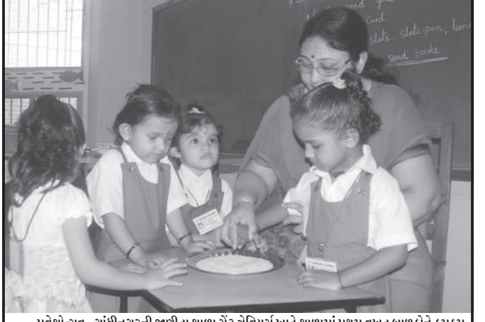
પ્રવેશોત્સવ - ગાંધીનગરની જાણીતા શાળા સેંટ ઝેવિયર્સ ખાતે શાળામાં પ્રથમ વખત બાળકોને કુમકમ તિલક કરી, સાકરથી મો-મીઠું કરાવી વિદ્યારંભ કરાવ્યો હતો.

અમદાવાદ જિલ્લામાં તા. ૧૩, ૧૪, ૧૫ જૂન-૨૦૧૩ દરમિયાન ગ્રામ્ય વિસ્તારમાં શાળા પ્રવેશોત્સવ કાર્યક્રમનો પ્રારંભ થશે. અમદાવાદ જિલ્લામાં શાળા પ્રવેશોત્સવ કાર્યક્રમ દરમિયાન ૧૦,૨૩૬ કુમાર અને ૯,૬૫૦ કન્યા સહિત કુલ ૧૯,૮૮૬ બાળકોને ધો. ૧માં શાળા પ્રવેશ આપવામાં આવશે. જિલ્લામાં ૫૦ કુમાર અને ૪૮ કન્યા સહિત કુલ ૧૦૫ વિકલાંગ બાળકો તેમજ ૧૩ બાળકોને પુન: શાળામાં પ્રવેશ અપાશે. અમદાવાદ જિલ્લામાં પુરૂષ સાક્ષરતા દર ૮૦.૭૩ ટકા જ્યારે સ્ત્રી સાક્ષરતા દર ૭૦.૮૩ ટકા છે. જિલ્લાનો કુલ સાક્ષરતા દર ૭૯.૫૦ ટકા છે. અમદાવાદ જિલ્લામાં વર્ષ ૧૧-૧૨નો ડ્રોપઆઉટ રેટ ૨.૬૬ ટકા રહ્યો છે.