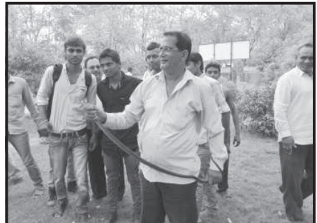
ગાંધીનગર શહેરમાં આવેલ માધ્યમિક શિક્ષણ બોર્ડની કચેરીના કંપાઉન્ડમાં આજે બપોરના સુમારે સાપ નિકળતા હાજર લોકોમાં નાસભાગ મચી ગઈ હતી. જોકે ઉપસ્થિત કર્મચારીએ સાપને પકડી પાડ્યો હતો અને જંગલમાં છોડી મૂક્યો હતો.