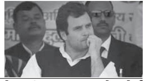
જણાઈ રહી છે. રાહુલ ગાંધીએ કહ્યું છે કે, તમામ લોકો સાથે પક્ષને જોડવામાં આવે તે જરૂરી છે. ચાર રાજ્યો મધ્ય પ્રદેશ, રાજસ્થાન, છત્તીસગઢ અને દિલ્હીને આ વર્ષે જ વિધાનસભાની ચૂંટણી યોજનાર છે.

પ્રતિનિધિત્વ આપવાની ખાતરી ગાંધીએ આપી હતી. પક્ષના પ્રવક્તા ભક્ત ચરણદાસે બેઠક બાદ પત્રકારો સાથે વાતચીત કરતા જણાવ્યું છે. જ્યારે જ સેક્રેટરી પૈકી માત્ર પાંચ જ મહિલાઓ છે. હવે આ પાંખમાં ૫૦ ટકા પ્રતિનિધિત્વ આપવામાં આવી જશે. તેવી સ્પષ્ટતા કરી હતી