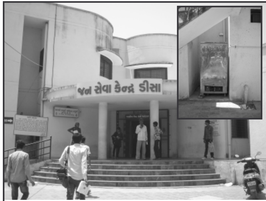
ડીસા મામલતદાર સ્થિત જનસેવા કેન્દ્રમાં કેટલાક સમયથી ફિજ બંધ હાલતમાં છે. જેને લઈ અધિકારીઓ અને મુલાકાતીઓ ગરમીમાં પીવાના પાણીથી પરેશાન થઈ ગયા છે. ત્યારે ફિજનું રીપેરીંગ કામ કરવામાં આવે તેવું ખેડૂતભાઈઓ અને મુલાકાતીઓ માંગ કરી રહ્યા છે.