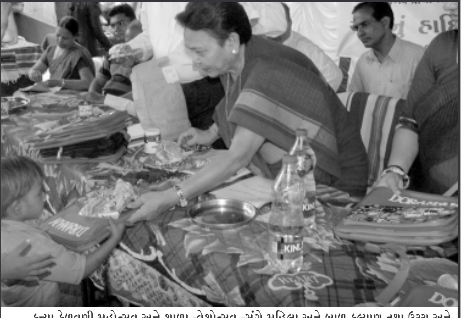
કન્યા કેળવણી મહોત્સવ અને શાળા -વેશોત્સવ -સંગે મહિલા અને બાળ કલ્યાણ તથા ઉચ્ચ અને ટેકનિકલ શિક્ષણ વિભાગના મંત્રીશ્રી ને. વસુભેન ત્રિવેદીએ બનાસકાંઠા જિલ્લાના અમીરગઢ તાલુકાના ઉપલોબંધ, નીચલોબંધ, આવલ ઘુંમટી, ડાભેલા, ડુંગરપુરા અને ખાપા ગામોની નાથમિક શાળાઓમાં બાળકોને ધો. ૧ માં -વેશ અપાવી ઉજ્જવળ કારકિર્દીની શુભેચ્છાઓ પાઠવી હતી. શાળા -વેશોત્સવ -સંગે દરેક ગામમાં ઉત્સાહ અને હર્ષનો માહોલ સર્જાય છે. આવા આનંદભર્યા માહોલમાં મંત્રીશ્રી ને. વસુભેન ત્રિવેદીના હસ્તે બાળકોને કુમકુમ તિલક કરી, માં મીઠું કરાવીને શાળામાં -વેશ અપવામાં આવ્યો હતો.

કૃષિ ઉત્પાદન વધ્યું છે. કૃષિમાં ખેડૂતોને શ્રીપ ઈરીગેશન પદ્ધતિ અપનાવીને વધુ ઉત્પાદન કરવા અનુરોધ કર્યો હતો. તેમજ જણાવ્યું હતું કે, કૃષિ મહોત્સવથી કિસાનોને ઘર આંગણે તજજ્ઞોનું, કૃષિ વેજાનિકોનું માર્ગદર્શન મળે અને ખેડૂતોને વિવિધ કલ્યાણકારી યોજનાઓની જાણકારી મળે તે આશયથી કૃષિ મહોત્સવનું આયોજન કરવામાં આવે છે. વધુમાં જણાવ્યું હતું કે, કૃષિ મહોત્સવ દરમિયાન ઊંઝા તાલુકાના ખેડૂતોને કૃષિ વિભાગ દ્વારા ૨૧૫ કીટ્સ, બાગાયત મહોત્સવના કારણે આજે રાજ્યભરમાં