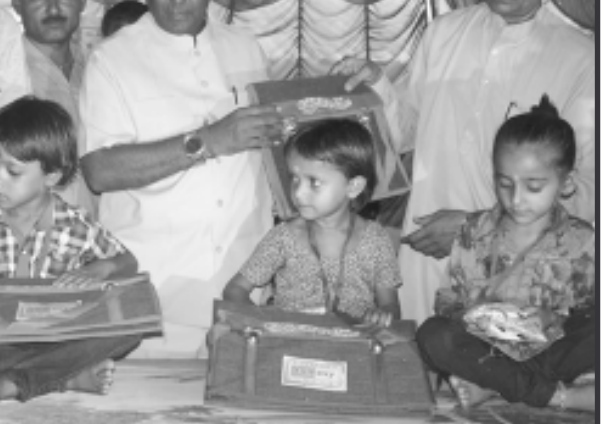
કન્યા કેળવણી મહોત્સવ અને શાળા -વેશોત્સવ-૨૦૧૪ -સંગે સામાજિક ન્યાય અને અધિકારીતા વિભાગના મંત્રીશ્રી રમણલાલ વોરાએ બનાસકાંઠા જિલ્લાના ડીસા તાલુકાના રસણા, ભોયણ, ધરપડા, ઢુવા અને કાંટ ગામની નાથમિક શાળાઓમાં બાળકોને ધો. ૧ માં -વેશ અપાવી ઉજ્જવળ અને સુખમય ભવિષ્યની શુભેચ્છાઓ પાઠવી હતી. ઉલ્લેખનીય છે કે શાળા -વેશોત્સવ -સંગે દરેક ગામમાં ઉત્સાહ અને હર્ષનો માહોલ સર્જાય છે. વાલીઓ પોતાના નાના બાળકને હરખથી શાળામાં -વેશ અપાવવા આવે છે. આવા આનંદભર્યા માહોલમાં મંત્રીશ્રી રમણલાલ વોરાના હસ્તે બાળકોને કુમકુમ કરી, તિલક માં મીઠું કરાવીને શાળામાં -વેશ અપવામાં આવ્યો હતો.

પરિવારનાં સારા કામોમાં વાપરવાની હદય-સ્પર્શી અપીલ કરી હતી. પોલીસ સુરક્ષા સેતુ હેઠળની પી.આઈ. કે. ડી. નકુમની આ ગાંધીગીરી સાંભળવા અને સમજવા વાહનચાલકો અને લોકોનાં ટોળે-ટોળાં એકઠા થયા હતા. જોકે દારૂ જેવી બદીથી અકસમાતો અને તમાકુ, ભીડી જેવા વ્યસનોથી રોગોનો ફેલાવો થાય છે અને તે બાદ પરિવારને શોસાવું પડે છે તેવું તેમને જણાવી આ અભિયાન જાગૃતિ માટે હોવાનું તેમને જણાવ્યું હતું, જયારે આ અભિયાનમાં અનેક વાહન ચાલકો જોડાયા હતા અને ભીડી, તમાકુ, સિગારેટ જેવા વ્યાસનોનો ત્યાગ કર્યો હતો અને પોલીસની આ કામગીરી બિરદાવી હતી.