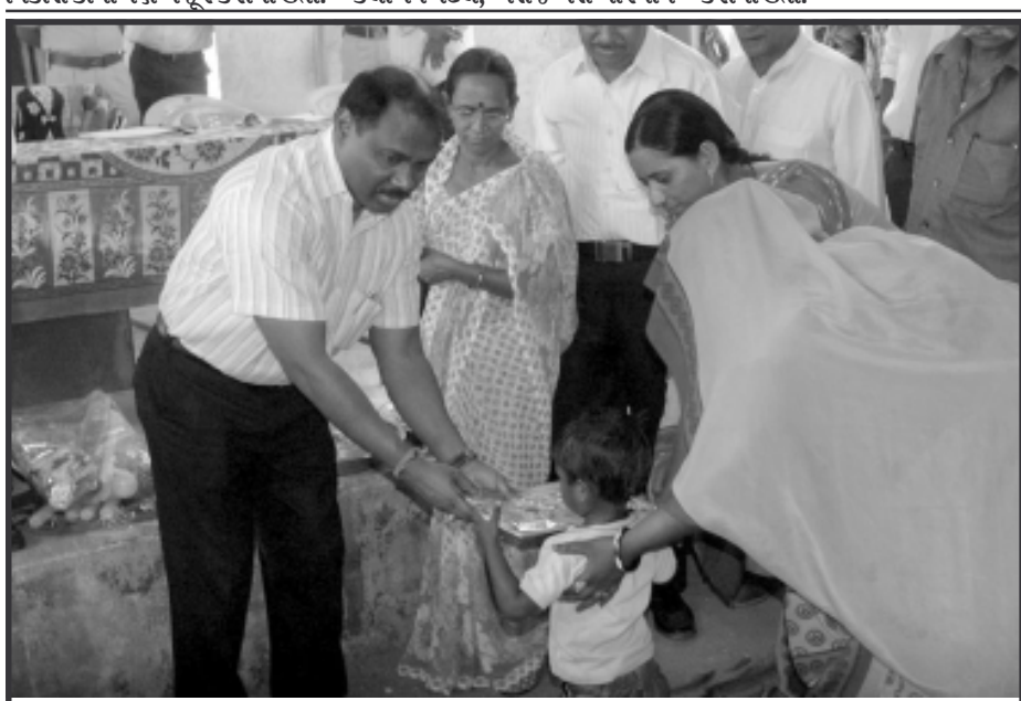
કન્યા કેળવણી મહોત્સવ અને શાળા -વેશોત્સવ -સંગે નિસીપલ સેક્રેટરી ટુ ચીફ મીનીસ્ટરશ્રી ગીરીશચંદ્ર મુર્મુએ બનાસકાંઠા જિલ્લાના અમીરગઢ તાલુકામાં ડેરી, મહાદેવીયા, કરઝા, ઉમરકોટ અને જેથી ગામની નાથમિક શાળાઓમાં બાળકોને -વેશ અપાવી શુભેચ્છાઓ પાઠવી હતી. આ -સંગે બાળકોને કુમકુમ તિલક કરી, માં મીઠું કરાવીને હર્ષભર્યા માહોલમાં શાળામાં -વેશ અપવામાં આવ્યો હતો.

ખેડબ્રહ્મા, તા. ૧૨ ખેડબ્રહ્મા નગરપાલિકાની સામાન્ય સભા મંગળવારે મળી હતી. જેમાં પાલિકામાં વિવિધ સમિતિઓની રચના કરવામાં આવી હતી. ખેડબ્રહ્મા નગરપાલિકાના પ્રમુખ વિનોદભાઈ પટેલના અધ્યક્ષસ્થાને મળેલી આ સામાન્ય સભામાં આ સમિતિઓના ચેરમેનોની પણ વરણી કરાઈ હતી. આ સભામાં રૂપિયા ૫૦ લાખના વિકાસ કાર્યો પણ મંજૂર કરાયા હતાં.