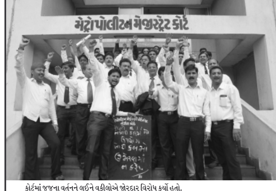
કોર્ટમાં જજના વર્તનને લઈને વકીલોએ જોરદાર વિરોધ કર્યો હતો.