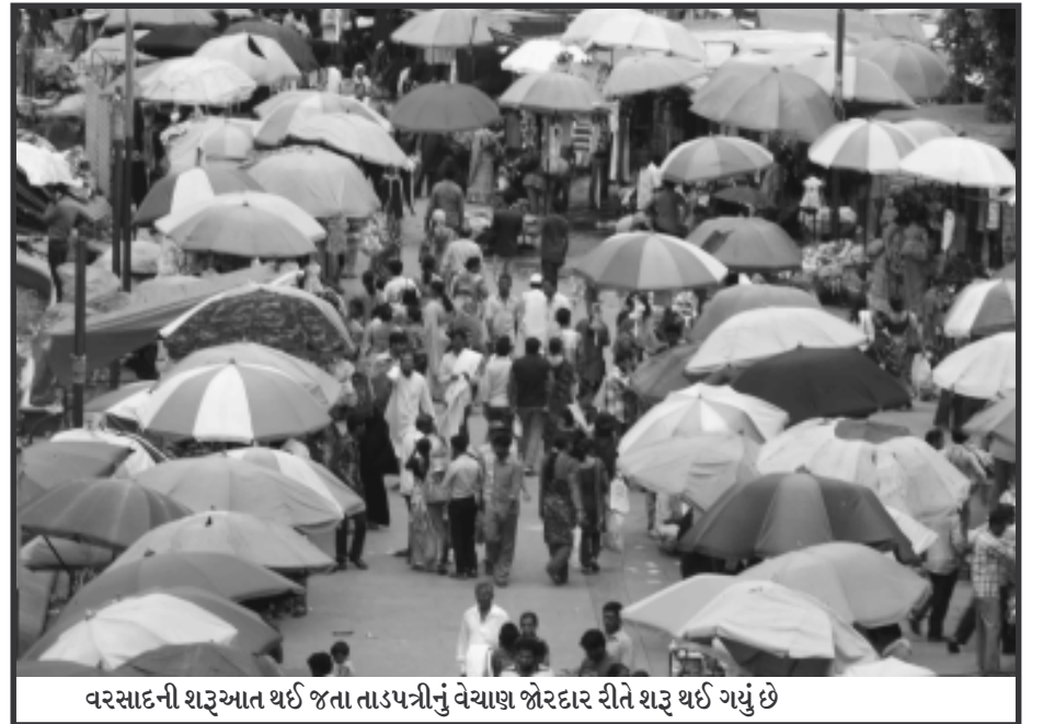
વરસાદની શરૂઆત થઈ જતા તાડપત્રીનું વેચાણ જોરદાર રીતે શરૂ થઈ ગયું છે

૨૦૦૪માં કરવામાં આવી હતી તેના માત્ર બોર્ડ જ લાગેલ હોઈ તેના અત્યાર સુધીમાં રૂ. ૨૫૦ કરોડ ખર્ચ કરી દેવામાં આવ્યા છે. ગ્યાસપુર પાસે ૨.૫૨ લાખ વાર જગ્યા મેટ્રો રેલ માટે રૂપો બનાવવા જગ્યા રાજ્ય સરકાર દ્વારા મોંગવામાં આવી છે, પરંતુ મોટેરા ખાતે લાખો વાર ખુલ્લી જગ્યા હોવાથી ત્યાં મધર રૂપો બનાવવા માટે વિરોધ પક્ષ સૂચન કર્યું છે.