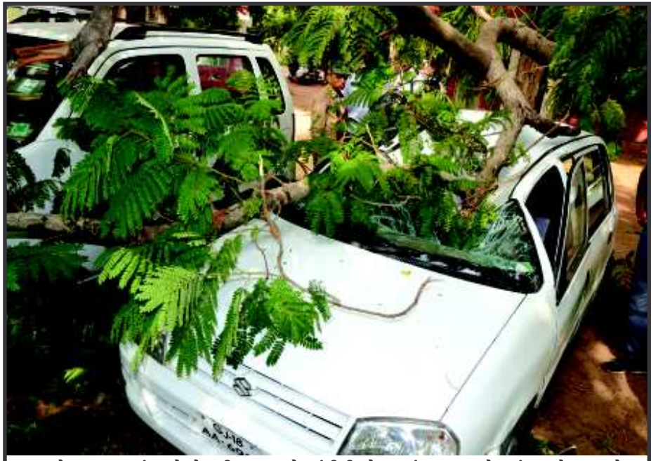
એ... જાડ પડ્યું - હવે તોફાની પવન અને આંધીની મોસમમાં આવા દર્શ્યો વારંવાર જોવા મળશે... ગાંધીનગરમાં કેટલાય વયોવૃદ્ધ વૃક્ષો ભારે પવનના કારણે નમી પડે છે, ક્યારે ડાળખા તૂટી પડે છે અને ક્યારે આખાને આખા વૃક્ષ પડી જાય છે... માણસ કરતાં ગાડીઓને વૃક્ષો વધુ ઈજા કરે છે... વૃક્ષ નીચે મુકાયેલી કાર વૃક્ષની ડાળી પડતા એક ગરીબી ગાય થઈ જાય છે...