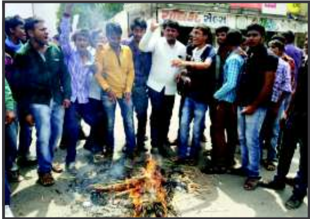
જ દિવસોમાં રેલભાડામાં વધારો ઝીંકી દીધો છે. જેના દેશભરમાં ઘેરા પ્રત્યાઘાત પડયા છે. એનએસયુઆઈએ શનિવારના રોજ કલોલ ખાતે મોટી સંખ્યામાં ઉમટી પડી

ગાંધીનગર, તા. ૨૧ મોંઘવારીના મુદ્દે બહુમતી હાંસલ કરી સત્તારૂઢ થયેલ ભાજપની મોટી સરકારે સત્તા સંભાળ્યાના થોડાક