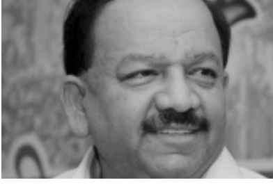
જ જૂની વિચારધારા છે. આનાથી અગાઉ પણ વિવાદ થઈ ચુક્યો છે. હર્ષવર્ધનને અગાઉ કોન્ગ્રેસને લઈને આપવામાં આવેલા તેમના નિવેદનને ખોટી રીતે રજૂ કરવામાં આવ્યું છે. સેક્સ એજ્યુકેશન ઉપર પ્રતિબંધ મુકવાની વાત તેઓએ કરી નથી. સેક્સ એજ્યુકેશન જરૂરી છે પરંતુ તેમાં અશ્લિલતા સામેલ કરવી જોઈએ નહીં.

આરોગ્યમંત્રીએ કહ્યું હતું કે, મિડિયામાં તેમના નિવેદનને ખોટી રીતે રજૂ કરવામાં આવ્યું છે. સેક્સ એજ્યુકેશન ઉપર પ્રતિબંધ મુકવાની વાત તેઓએ કરી નથી. સેક્સ એજ્યુકેશન જરૂરી છે પરંતુ તેમાં અશ્લિલતા સામેલ કરવી જોઈએ નહીં.