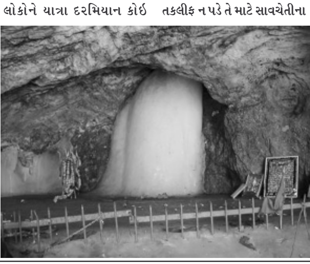
લોકોને યાત્રા દરમિયાન કોઈ તકલીફ ન પડે તે માટે સાવચેતીના પગલા લેવામાં આવી રહ્યા હતા. શ્રદ્ધાળુઓ પણ યાત્રાને લઈને ઉત્સુક છે. અમરનાથ યાત્રા ૨૮મી જૂનથી માત્ર વાયા બાલટાલથી શરૂ થઈ રહી છે. વાયા પહલગામથી યાત્રા શરૂ થવામાં હજુ થોડાક સમય લાગશે. ટ્રેકની સ્થિતિ જાણી લીધા બાદ વાયા પહલગામને મંજૂરી અપાશે. દરિયાઈ સપાટીથી આશરે ૩૮૮૮ મીટરની ઉંચાઈએ સ્થિત અમરનાથની પવિત્ર ગુફાની વાર્ષિક યાત્રા આ વર્ષે ૨૮મી જૂનથી શરૂ કરવામાં આવ્યા બાદ લોકોમાં ભારે ઉત્સાહ હતો. અમરનાથ ગુફા

જમ્મુ, તા. ૨૭ જૂન - શ્રદ્ધાળુઓ ઉત્સુકતાપૂર્વક રાહ જોઈ રહ્યા હતા તે વાર્ષિક અમરનાથ યાત્રા આવતીકાલથી સઘન સુરક્ષા અને ભારે ઉત્સાહ વચ્ચે શરૂ થઈ રહી છે. આવતીકાલે શોર્ટ કપ ગણાતા બાલટાલથી યાત્રા શરૂ કરાશે. બાલટાલથી શ્રદ્ધાળુઓનો પ્રથમ કાફલો આવતીકાલે રવાના થનાર છે. સુત્રોએ કહ્યું છે કે આ વખતે પણ અમરનાથ યાત્રા બે રસ્તાથી શરૂ કરાશે. પરંતુ પહલગામ-ચંદનવાડી રસ્તાને