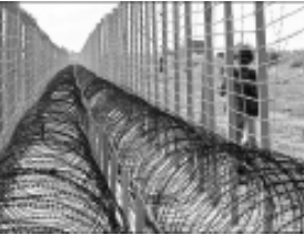
પાકિસ્તાન દ્વાર યુદ્ધવિરામના ભંગનો દોર જારી રાખવામાં આવ્યો છે. દેશમાં નવી નરેન્દ્ર મોદી સરકાર આવ્યા બાદ પણ પાકિસ્તાન દ્વારા અંકુશ રેખા પર ગોળીબાર કરવામાં આવ્યો છે. પાકિસ્તાની સેનિકોએ જમ્મુ કાશ્મી