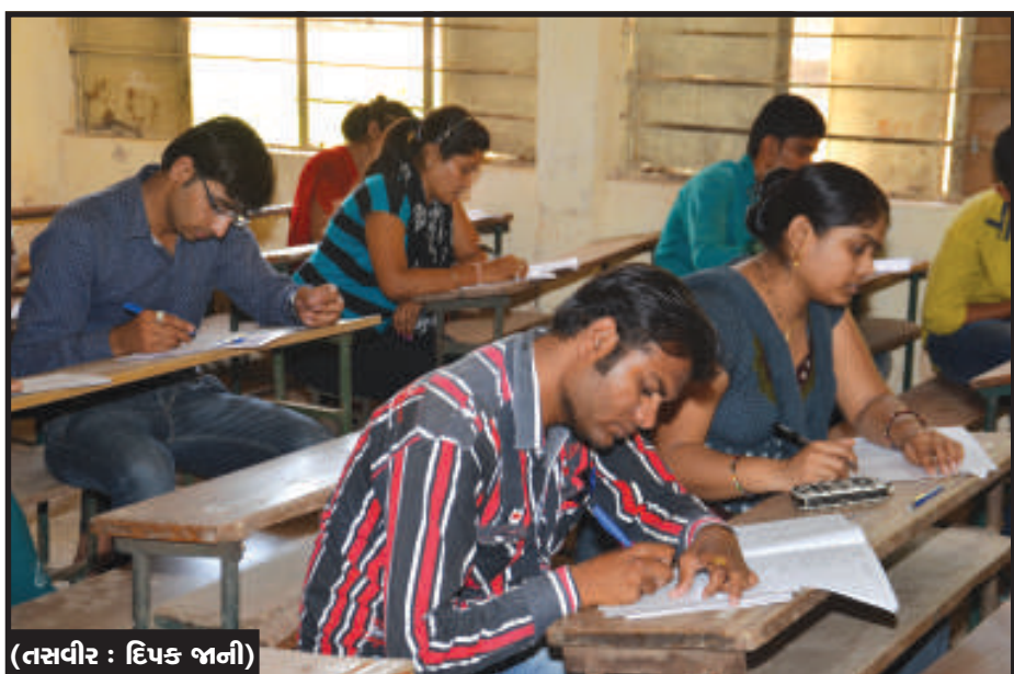
દ્વારા તલાટી સંવર્ગની પરીક્ષા યોજાઈ હતી. આ પરીક્ષા જિલ્લાની ૬૨ સ્કુલોમાં યોજવામાં આવી હતી. જેમાં કુલ ૨૦૮૪૦ પરીક્ષાર્થીઓએ ભાગ લીધો હતો. પરીક્ષામાં મેરિટ ઉચું રહેવાની આશંકા પણ સેવાઈ રહી છે. જિલ્લાની ૬૨ શાળાઓના કુલ ૬૮૮ બ્લોકમાં પરીક્ષા તંત્ર દ્વારા તલાટી પરિણામમાં મેરિટ ઉચું રહેવાની આશંકા પણ સેવાઈ રહી છે. જિલ્લાની ૬૨ શાળાઓના કુલ ૬૮૮ બ્લોકમાં પરીક્ષા તંત્ર દ્વારા તલાટી પરીક્ષામાં ૧૦૦ ગુણના પ્રશ્નપત્રમાં એક કલાકના સમયગાળામાં ૧૦૦ પ્રશ્નોના ઉત્તર આપવાના હતા. ઓએમઆર પદ્ધતિથી લેવાયેલ આ પરીક્ષામાં ૧૦૦ ગુણના પ્રશ્નપત્રમાં

ગણિત, અંગ્રેજી, ગુજરાતી અને સામાન્ય જ્ઞાનના વિષયોને આવરી લેવાયા હતા. સામાન્ય જ્ઞાનને લગતા પ્રશ્નોમાં ગુજરાત સાહિત્ય અકાદમીના પ્રમુખ કોણ છે, એકદૈનિક અખબારમાં સ્પેક્ટ્રોમીટર કોલમના લેખક કોણ છે, વખતની પ્રથામાં અન્ય જિલ્લાઓ કરતા ગાંધીનગર જિલ્લાનું પ્રશ્નપત્ર પ્રમાણમાં સરળ હોવાનું પરીક્ષાર્થીઓમાં ચર્ચાઈ રહ્યું હતું. જો કે સરળ પ્રશ્નપત્રના કારણે પરિણામમાં પણ મેરિટ ઉચું રહેવાની