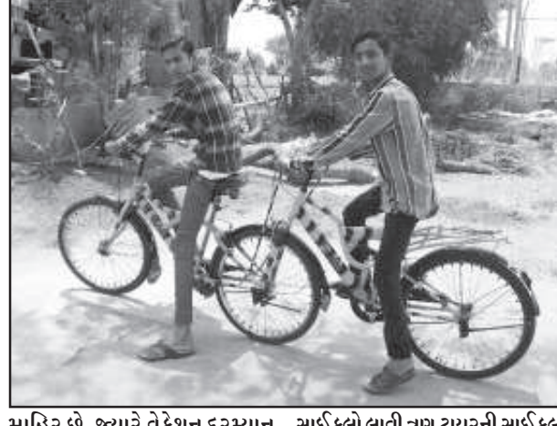
માહિર છે. જ્યારે વેકેશન દરમિયાન બન્ને મિત્રોએ ભંગારમાંથી બે સાઈકલો લાવી ત્રણ ટાયરની સાઈકલ બનાવી છે. જે માત્ર ૧૭ દિવસમાં