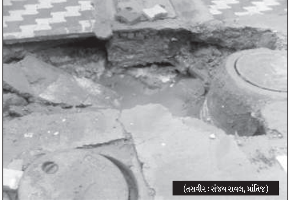
(તસ્વીર : સંજય રાવલ, પ્રાંતિજ)

બપોર પછી હળવા ઝાપટાં સાથે શરૂ થયેલ વરસાદ : ઠેર ઠેર પાણી ભરાયાં : ચોમાસા પહેલા જ્યાં ત્યાં ખોદકામ કરતા લોકોની મુશ્કેલીઓ વધી : વાહનો ગટરલાઈનમાં ફસાયા