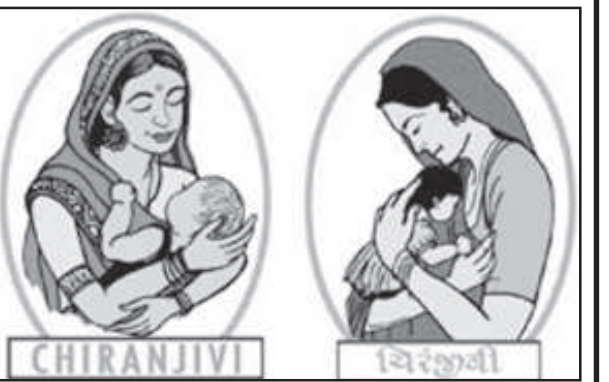
નાયકે જણાવ્યું હતું કે મોડાસામાં ચિંરજીવી યોજનામાં જોડાયેલ તબીબોએ રાજીનામા આપી દીધા છે.

યોજનામાં જોડાયેલ તબીબોએ આરોગ્ય વિભાગ સક્ષમ રાજીનામા ધરતાં સરકારની યોજના કાર્યરત હોવા છતાં ગરીબો દર્દીઓને ફરજિયાત નાણા આપીને સારવાર મેળવવાનો વારો આવ્યો છે. મોડાસા તાલુકાના આરોગ્ય અધિકારી ડો. યજ્ઞેશ