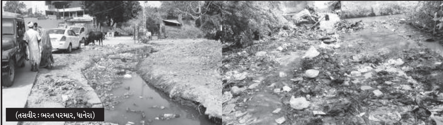
(તસવીર : ભરત પરમાર, ધાનેરા)

એક તરફ દેશ ના વડાપ્રધાન સ્વચ્છ ભારત બનવવા માટે લાખો કરોડો નો ધુમાડો કરી રહ્યાં છે તો બીજી તરફ બનાસકાંઠા ના ધાનેરા ની ભાજપ શાસિત નગર પાલિકા સ્વચ્છ ભારત અભિયાનના ધજ્યા ઉડાવી રહી છે માટે લોકો પણ ક્ષી રહ્યાં છે કે સ્વચ્છ ભારત ની મોટીમોટી વાત કરનાર જરા આ બાજુ પણ એક નજર કરો. ઉભરાયલી ગટરો ગંદકી ઠગલા અને ગંદકી થી ત્રાસી ગયેલા લોકો ના ટોળા આ દ્રશ્યો છે બનાસકાંઠા જીલ્લા માં આવેલા ધાનેરા ના કે જ્યાં ભાજપ શાસિત નગરપાલિકા સ્વચ્છ ભારત અભિયાનના કેવા ધજગરા ઉડાવી રહી છે તે તો આ દશ્યોજ બતાવી રહ્યાં છે ધાનેરા માં જ્યાં જુઓ ત્યાં ગંદકી જ ગંદકી જોવા મળી રહી છે અને ધાનેરા ના કેટલાક ઈલાકામાં તો ક્યારે સફાઈ થતીજ નથી ધાનેરા માં બધીજ જગ્યાએ ગટરો ઉભરાયલી જોવા મળે છે અને આવા ગંદા પાણી માં કેટલાક નાના બાળકો પડી પણ જાય છે અને આવી ગંદકી ના કારણે જો ધાનેરા માં રોગચાળો ફાટી નીકળશે તો તેના માટે જવાબદાર કોણ ? તો બી જી તરફ ગંદકી થી કંટાળેલા લોકો પોતાના ખર્ચે માણશ બોલાવી પોતાના ઈલાકા ની સફાઈ કરાવે છે .