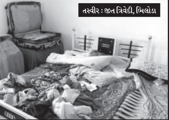
તસવીર : જીત ત્રિવેદી, મિલોડા

વિસ્તારમાં આવેલ ચંદ્રપુરી સોસાયટીમાં પાંચ મકાનમાં શનીવારે મધ્યરાત્રે અજાણ્યા તસ્કરો ત્રાટક્યા હતા. ચંદ્રપુરી સોસાયટીમાં પાંચ મકાનોને તસ્કરોએ નિશાન બનાવી અંદાજીત રૂા. ૫,૦૦,૦૦૦/-ની માલમત્તાની અને કોમર્શીયલ ટુકાનોમાં દિન-પ્રતિ-દિન ચોરીઓનો ઉપદ્રવ વધતાં મધ્યરાત્રે અજાણ્યા તસ્કરો ત્રાટક્યા હતા. ચંદ્રપુરી સોસાયટીમાં પાંચ મકાનોને તસ્કરોએ નિશાન બનાવી અંદાજીત રૂા. ૫,૦૦,૦૦૦/-ની માલમત્તાની