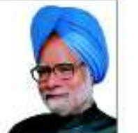
શ્રી. મનુકેશન સિંઘ મહેતાજી

81 કરોડ લોકોને અજ્ઞ સુરક્ષા કાયદા હેઠળ અનાજનો અધિકાર મળ્યો 4.98 કરોડ પરિવારોને મન્દરેગાથી રોજગારી 19.97 કરોડ બાળકોને મળ્યો અનિવાર્ય અને મજૂત શિક્ષણનો અધિકાર ₹ 1,95,000 કરોડથી વધુ બેંક લોન લઘુમતિઓને અપાઈ છેલ્લા 10 વર્ષોમાં ખેડૂતોને બે ગણાથી વધુ લઘુતમટકાના ભાવો મળ્યા અનાજ ઉત્પાદનમાં અનેક વિક્રમો તોડ્યા, ચોખાનું ઉત્પાદન 830 લાખ ટનથી વધીને 1061.9 લાખ ટન, ઘઉંનું ઉત્પાદન 680 લાખ ટનથી વધીને 956 લાખ ટન થયું ગામડાઓમાં 35 કરોડથી વધુ ટેલીફોન જોડાણ પહોંચ્યા દસ વર્ષમાં 18,200 કિલોમીટર હાઈવેનું નિર્માણ અને સુધારણા છેલ્લા 4 વર્ષોમાં ભારતમાં $ 175 અરબનું સીધું વિદેશી રોકાણ છેલ્લા 9 વર્ષોમાં ભારતીય નિકાસ ₹ 2,93,367 કરોડથી વધીને ₹ 16,34,319 કરોડ થઈ