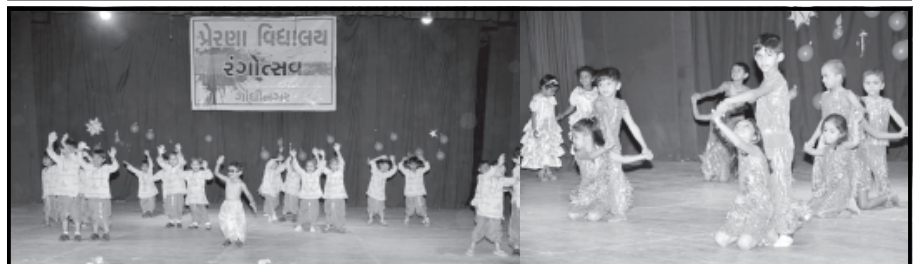
વાર્ષિકોત્સવ - ગાંધીનગર શહેરમાં હમણાં શાળા-મહાશાળાનો વાર્ષિકોત્સવ અને સ્પોર્ટ્સ મીટનો માહોલ જામ્યો છે... તાજેતરમાં પ્રેરણા વિદ્યાલય, સેક્ટર-૫નો વાર્ષિકોત્સવ ગાંધીનગર ટાઉન હોલ ખાતે યોજાઈ ગયો. પ્રેરણા વિદ્યાલયના રંગોત્સવ કાર્યક્રમ અંતર્ગત વિદ્યાર્થીઓએ વિવિધ કૃતિઓ રજૂ કરી પ્રેક્ષકોના મન મોહી લીધા હતા.

ગાંધીનગર, તા. ૧ શહેરમાં છ હજાર મકાનોમાં શૌચાલયોની સુવિધા નથી. આ મકાનોમાં આ સુવિધા ઉપલબ્ધ બને તે દિશામાં કાર્યવાહી કરવા સરકારે મનપા સત્તાવાળાઓને લક્ષ્યાંક ફાળવી આગળ વધવા જણાવ્યું છે.