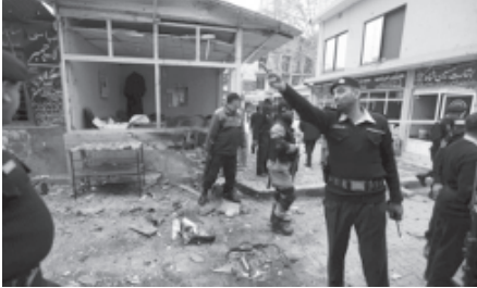
આવી છે. આશરે ૧૨થી વધુ લોકો ગંભીર બનેલા છે. માર્યા ગયેલાઓમાં સેશન જજનો પણ

મેડિકલ સાયન્સના પ્રવક્તાએ કહ્યું છે કે, ઘાયલ થયેલા લોકો પૈકી ઘણાની હાલત ગંભીર જણાવવામાં આવી છે. આશરે ૧૨થી વધુ લોકો ગંભીર બનેલા છે. માર્યા ગયેલાઓમાં સેશન જજનો પણ સમાવેશ થાય છે. શહેરના લોકપ્રિય એવા સમુદ્ર નિવાસી સેક્ટરમાં સ્થિત કોર્ટની આસપાસના રસ્તાઓની સીલ મળેલી માહિતી મુજબ સવારે નવ વાગ્યાની આસપાસ ૧૫ જેટલા વાગ્યાના પોલીસ ઈકોનોએ કોર્ટ સંકુલને ઘેરી લઈને ચેમ્બરમાં પ્રવેશી હુમલો કર્યો હતો. હુમલાખોરો પાસે હેન્ડગ્રેનેડ અને ખતરનાક હથિયારો હતા. પાકિસ્તાન સરકારે ગઈકાલે જ જાહેરાત કરી હતી કે, આત્મઘાતી વિસ્તારોમાં તાલિબાની અક્રાઓ ઉપર હવાઈ હુમલા બંધ કરવામાં આવ્યા છે. ગયા મહિને સરકારે તરફિદે તાલિબાન પાકિસ્તાન સાથે વાતચીત ચાલુ કરી હતી પરંતુ ગાસવાદીઓએ ૨૩ સેનિટોની હત્યા કરી દીધા બાદ મંત્રણા પ્રક્રિયા બંધ કરી દેવામાં આવી હતી.