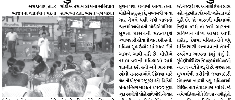
મોદીએ તમામ લોકોના અભિપ્રાય સાંભળ્યા હતા. ભારત ખુબ પછાત

અમદાવાદ, તા. ૮ ભાજપના વડાપ્રધાન પદના મોદીએ તમામ લોકોના અભિપ્રાય સાંભળ્યા હતા. ભારત ખુબ પછાત