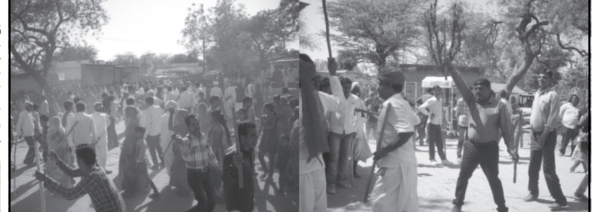
હોળી ધૂળેટી પર્વની ઉજવણી વર્ષોની પરંપરા મુજબ ઉજવવામાં આવે છે. આજે પણ રાજસ્થાનથી આવેલ મારવાડી માળી સમાજના પરિવારોમાં ગૈરી પાસે ઢોલના તાલે ગેર રમી ધૂળેટીનો ઉત્સવ મનાવવામાં આવે છે. ગ્રામજનો ધોત ખમીસ પાઘડી અને હાથમાં લાકડીઓ લઈ અનેરો ઉત્સવ ઉજવે છે.

સોનેરીપુરા પાલોદર અને બહાર જવાનો માર્ગ પણ તે જ રહેશે. પાર્કિંગ વ્યવસ્થા પ્રાથમિક શાળા પાલોદર નજીક રહેશે. આ હુકમનો ભંગ કરનાર શિક્ષાને પાત્ર ગણાશે. આ હુકમ ૨૬ માર્ચ ૨૦૧૪ થી ૨૮ માર્ચ ૨૦૧૪ દરમિયાન લાગુ પડશે તેમ અધિક જિલ્લા મેજસ્ટ્રેટ મહેસાણાની અખબારી યાદીમાં જણાવવાયું છે.