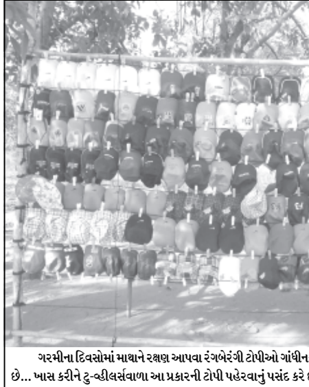
ગરમીના દિવસોમાં માથાને રક્ષણ આપવા રંગબેરંગી ટોપીઓ ગાંધીનગરના માર્ગો પર વેચાણ માટે ગોઠવાઈ છે... માસ કરીને ટુન્ડીલવસંવાળા આ પ્રકારની ટોપી પહેરવાનું પસંદ કરે છે...

સો-૧૬ માં રહેતા સાયન્સના વિદ્યાર્થીનો પોતાના ઘરે ગળે ફાંસો એસ.વાય.બી.એસ.સી.માં આવેલી એ.ટી.કે.ટી.થી હતાશ થઈ આપઘાત કર્યો હોવાની આશંકા ગાંધીનગર, તા. ૨૦ મળ્યું છે. સે-૨ ૧ પોલીસે અકસ્માત શહેરના સેક્ટર-૧૬ માં રહેતા અને એસ.વાય.બી.એસ.સી.માં અભ્યાસ કરતા વિદ્યાર્થીએ પોતાના ઘરે જ ગળે ફાંસો ખાઈ આપઘાત કરી લેતા ચક્રચાર મચી જવા પામી છે. પોલીસે કરેલી પ્રાથમિક તપાસમાં વિદ્યાર્થીને પરીભામાં આવેલી એ.ટી.કે.ટી.ને કારણે તેણે અંતિમ પગલું ભર્યું હોવાનું જણવા મળ્યું છે. સે-૨ ૧ પોલીસે અકસ્માત મોતનો ગુનો દાખલ કરી મુતદેહ પીએમ માટે મોકલી વધુ તપાસ શરૂ કરી છે.