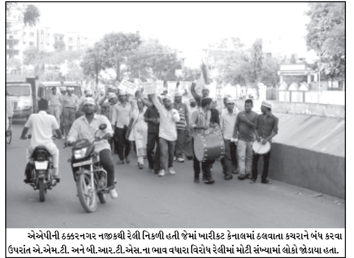
એએપીની ઠક્કરનગર નજીકથી રેલી નિકળી હતી જેમાં પ્યારીકટ કેનાલમાં ઠલવાતા કચરાને બંધ કરવા ઉપરાંત એ.એમ.ટી. અને બી.આર.ટી.એસ.ના ભાવ વધારા વિરોધ રેલીમાં મોટી સંખ્યામાં લોકો જોડાયા હતા.

કલાક દરમિયાન લેવામાં આવશે. ધોરણ ૧૨ સામાન્ય પ્રવાહમાં આવતીકાલે દ્વિતિય ભાષા હિન્દીનું પેપર લેવામાં આવશે. આ પરીક્ષા બપોરે ૩.૦૦થી ૬.૧૫ કલાક દરમિયાન લેવાશે. આ ઉપરાંત ધોરણ ૧૨ વ્યવસાયલક્ષી પ્રવાહમાં આવતીકાલે હિન્દી (દ્વિતિય ભાષા)નું પેપર લેવામાં આવશે.