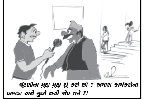
ચૂંટણીના મુદ્દા મુદ્દા શું કરો છો ? અમારા કાર્યકરોના બાવડા અને મુછો નથી બેઠ તમે ??