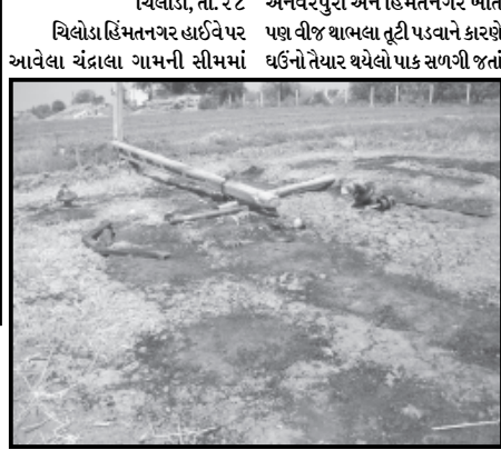
વિલોડા, તા. ૨૮ અનવરતુ અને હિંમતનગર ખાતે વિલોડા હિંમતનગર હાઈવે પર આવેલા ચંદ્રાલા ગામની સીમમાં

એક સપ્તાહમાં જ થાંભલા તુટી પડવાની સતત ત્રીજી ઘટના : પસાર થઈ રહેલી સ્કૂલવાન સહેજ માટે બચી જતા નાના ભૂલકાંઓનો આબાદ બચાવ : મોટી જાનહાની અને ખેતીનું નુકસાન ટાળવા વિજ સત્તાવાળાઓ સત્વરે થાંભલાઓનું સર્વેક્ષણ કરે તે માટે માંગ