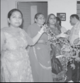
માટેનો હસ્તકલા, ભરતગુંથણ, ગુહઉદ્યોગની વિવિધ પ્રકારની વસ્તુઓ બનાવવા માટેનો ૧૫ દિવસનો તાલીમ વર્ગ માર્કેટ યાર્ડ થરા મુકામે યોજાઈ ગયો.