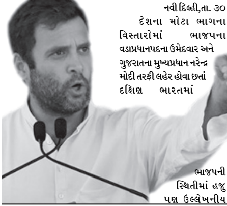
નવી દિલ્હી, તા. ૩૦ દેશના મોટા ભાગના વિસ્તારોમાં ભાજપના વડાપ્રધાન પદના ઉમેદવાર અને ગુજરાતના મુખ્યપ્રધાન નરેન્દ્ર મોદી તરફી લહેર હોવા છતાં દક્ષિણ ભારતમાં ભાજપની સ્થિતિમાં હજુ પણ ઉલ્લેખનીય

કબૂલાત : ઉત્તર ભારતમાં નમો નમો : દક્ષિણમાં મોટી કરતા રાહુલ લોકપ્રિય : પૂર્વીય ક્ષેત્રમાં ઘણા સમીકરણો