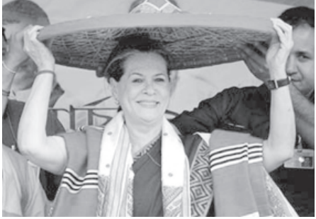
આસામના લખીમપુરમાં એક ચૂંટણી રેલીને સંબોધતા સોનિયા ગાંધીએ કહ્યું હતું કે, વિરોધ પક્ષો અને ખાસ કરીને ભાજપ દ્વારા મોટી મોટી વાત કરવામાં

સ્લોગન હર ડાય શક્તિ હર ડાય તરફીનો રહ્યો છે. તેમણે લોકોને યાદ અપાવી હતી કે, કોંગ્રેસે તેના વચનો પાળ્યા છે. અમે મોટા વચનો આપતા નથી. અમે અમારા વચનો પાળી બતાવ્યા છે અને ભવિષ્યમાં પણ અમારા વચન પાળીશું. આના માટે આપના ટેકાની જરૂર છે. કોંગ્રેસે ઐતિહાસિક સિદ્ધિઓ મેળવીને આરટીઆઈ, મનરેગા અને કુડ સિક્યુરિટી જેવા કાયદા દેશને આપ્યા છે. આ ઉપરાંત આદિવાસીઓના રક્ષણ માટે અમે ખાસ કાયદો આપી ચુક્યા છે. ચૂંટણી રેલીને સોનિયા ગાંધી સંબોધવા માટે પહોંચ્યા ત્યારે લોકો અને કાર્યકરોમાં ઉત્સાહ દેખાઈ રહ્યો હતો. ઉત્તરપૂર્વના લોકો વાસ્તવિક રાષ્ટ્રવાદને જાણે છે. રાષ્ટ્રવાદના બોગસ ચીત ગાઈ રહેલા લોકોને બોધવાઈ ભણાવવાનો સમય આવી ગયો છે. સોનિયા ગાંધીએ કહ્યું હતું કે, કોંગ્રેસે વિકાસમાં મહત્વપૂર્ણ ભૂમિકા ભજવી છે. સમાજના તમામ વર્ગોના લોકો માટે કામ કર્યું છે.