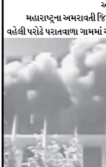
અમરાવતી, તા. ૩૦ સ્ટેશનના પોલીસ અધિકારીએ માહિતી આપતા કહ્યું છે કે, આગને કાબૂમાં લેવા માટે તરત જ ફાયરબ્રિગેડની ટુકડી પહોંચી ગઈ હતી. શોર્ટસર્કિટના કારણે આગ લાગી હોવાનું જાણવા મળ્યું છે. આના કારણે સાડી અને ડ્રેસ મટિરિયલ્સની ચીજવસ્તુઓ નાશ પામી હતી. પોલીસે કહ્યું છે કે, દુકાનની અંદર ફસાઈ ગયેલા લોકો બચી શક્યા ન હતા. ગામવાળાઓએ આગને કાબૂમાં લેવા પોલીસની મદદ કરી હતી પરંતુ સાત લોકોના મોત થઈ ગયા હતા.

મહારાષ્ટ્રના અમરાવતી જિલ્લામાં આજે વહેલી પરોઢે પરાતવાળા ગામમાં એક દુકાનમાં