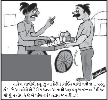
સાહેબ ખાત્રીથી કર્યું છે આ કેરી કાબાઈડ વાળી નથી જ... પરંતુ શંકા છે આ લોકોએ કેરી પકવવા આનાથી પણ વધુ ખતરનાક કેમીકલ શોધ્યું ન હોય કે જે બે પાંચ વર્ષ પકડાય જ નહીં...!