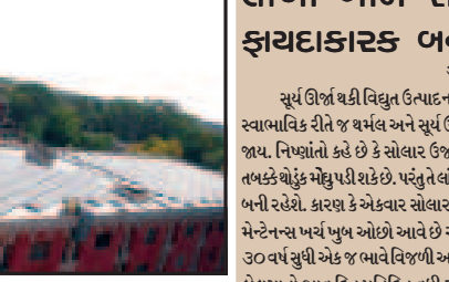
આ કામ માટે બહારથી કેન મંગાવી ચોથા માળ ઉપર એટલે કે છત ઉપર લઈ જવી પડે છે. જેમાં ખુબજ તકલીફ પડી રહી છે. વળી સરકારી ઉમારતો હોવાથી કર્મચારીઓની અવજન વધુ હોવાથી અકસ્માતની સંભાવના રહેતી હોવાથી આ કામમાં ખુબજ કાળજી અને ચોકસાઈ રાખવી પડે છે. સરકારી ઉમારતમાં લીફ્ટ ન હોવાના કારણે આ સોલાર પ્લેટ કેન મારફત ઉપર લઈ જવાથી સમય પણ વધુ લાગતો હોવાથી ચોક્કસ આ કામ વધુ સમય માગી લે છે.