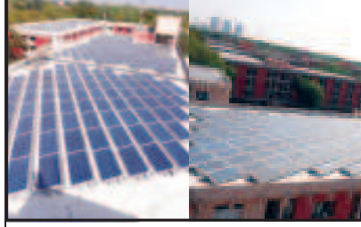
લેશો અને એટલું જરૂરથી બંધકાંચે 'ભઈ' સાબ હવે સુર્યદાદા ઓછું તપે તો સાડા. ઉનાળામાં એકદમ આકરા મીજાજમાં આવી જતા સૂર્યનારાયણ ગુજરાતના પાટનગર

કદમ સતત આગળ વધતું જાય છે : વસાહતીઓને ઉર્જા ઉત્પાદન પેટે યુનિટ દીઠ રૂ. ૩ ની ચુકવણી કરાય છે. ગાંધીનગરની સરકારી કચેરીઓને સોલાર ઉર્જાના ઉત્પાદન થકી દર મહિને હજારોથી વધારે રૂપિયા યુનિટના ઉત્પાદન થકી ચુકવવાય છે. વસાહતીઓના ઘરો હવે મીની