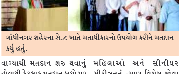
વોટિંગ કરતા જોવા મળ્યા હતા.

શહેરના વી.વી.આઈ.પી ગણાતા સેક્ટરમાં મોટા ભાગે આઈ.એ.એસ. આઈ.પી.એસ અધિકારીઓ રહે છે. સે. ૮, ૯ અને સે. ૧, ૨ ખાતે મતદાન માટેની લાઈન જ જોવા મળી ન હતી. એકલ દો કલ મતદારો