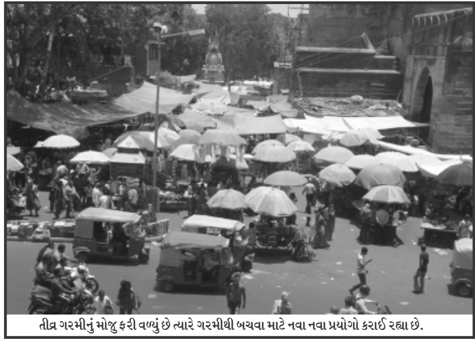
તીવ્ર ગરમીનું મોજુ ફરી વળ્યું છે ત્યારે ગરમીથી બચવા માટે નવા નવા પ્રયોગો કરાઈ રહ્યા છે.