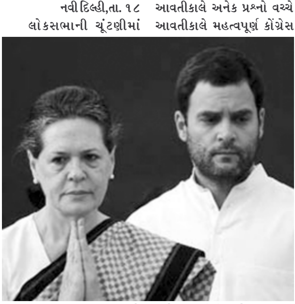
ભાજપની શાનદાર જીત અને યુપીએની કારમી હાર વચ્ચે કારોબારી સમિતિની બેઠક મળનાર છે. જેમાં તમામ મુદ્દાઓ ઉપર ચર્ચા

શ્રેણીબદ્ધ મુદ્દાઓ છવાશે : લોકસભાની ચૂંટણીમાં કારમી હારના કારણોમાં ચકાસણી થશે : જુદા જુદા રાજ્યોમાં રાજ્ય એકમોમાં ફેરફારના પણ અંધાણ : ભાવિ યોજના પર ચર્ચા થશે : નિષ્ક્રિય નેતાઓની હકાલપટ્ટી માટેની રૂપરેખા તૈયાર કરાશે