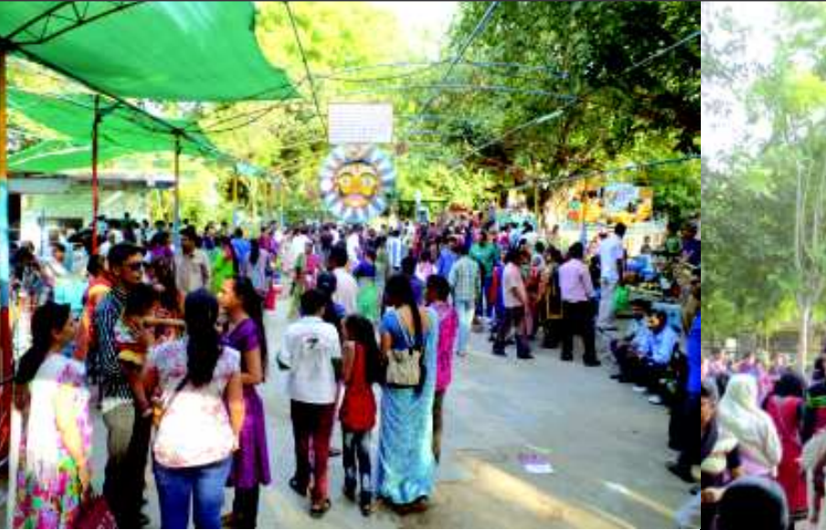
રજાઓની મજા - આજકાલ વેકેશનની મજા માણતા બાળકો અને વાલીઓ પિકનીક સ્થળો પર છલકાય છે... ગાંધીનગરના સેક્ટર-૨૮ના બગીચામાં વેકેશનનો રવિવાર હોય એટલે કે જાણે માનવ મહેરામણ ઉમટ્યો હોય... મેળાનો માહોલ સર્જાય છે... આસપાસના ગ્રામ્ય વિસ્તારમાંથી વેકેશનમાં બાળકોને રજાઓની મજામાં મસ્તી કરાવવા વાલીઓ લઈ આવે છે... સેક્ટર-૨૮માં આવેલી વિવિધ રાઈડ્સ, બોટીંગ અને હિંચકા તથા લપસણીની મોજ-મસ્તી ઉપરાંત મીની ટ્રેનની પણ બાળકો સહિત વાલીઓ મજા માણી હતી.

સ્પષ્ટ બહુમતી મળતા કેન્દ્રમાં ભાજપ સરકારની રચના થનાર છે ત્યારે ગુજરાતના મુખ્યમંત્રી નરેન્દ્ર મોદી વડાપ્રધાન બનવા જઈ રહ્યા હોઈ મુખ્યમંત્રી પદેથી નરેન્દ્ર મોદી ૨૧મી મેના રોજ રાજીનામું આપનાર છે. મુખ્યમંત્રી પદેથી નરેન્દ્ર મોદી રાજીનામું આપનાર હોઈ ખાલી