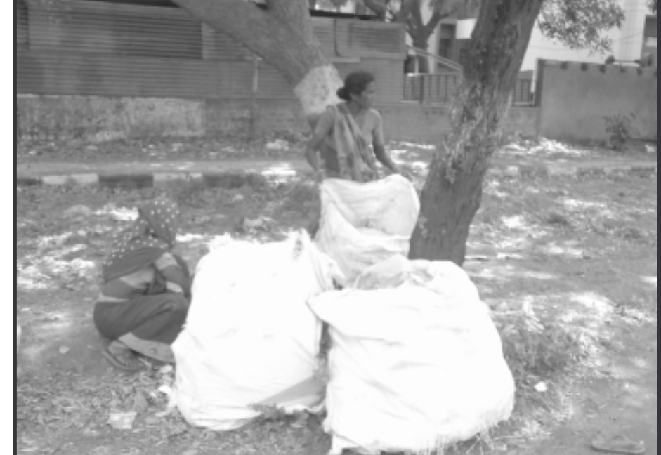
આવા ધોમધખતા તાપમાંયે કાળી મજૂરી કરી રહેલ આ સ્ત્રીઓની દશા વિશે સમાજ સેવી સંસ્થાઓએ દરકાર કરવા જેવી ખરી...!

અમદાવાદ શહેરના ગોમતીપુર વિસ્તારમાં અથડામણનો બનાવ બનતા ભારે તંગદીલી ફેલાઈ ગઈ હતી. અથડામણ દરમિયાન ઉકેરાયેલા ટોળાએ એકબીજા પર જોરદાર પથ્થર માર્યો કર્યો હતો અને વાહનોને આગ પજા ચાંપી હતી.