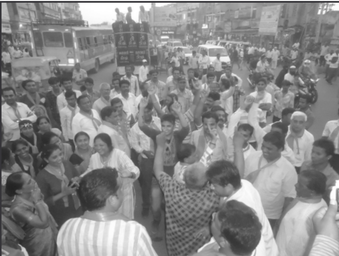
આજે દેશની રાજધાની દિલ્હી ખાતે રાષ્ટ્રપતિ ભવનના પ્રાંગણમાં મહામહિમ રાષ્ટ્રપતિશ્રી પ્રણવ મુખર્જીએ ભારતના વડાપ્રધાન તરીકે ગુજરાતના પૂર્વ મુખ્યમંત્રી શ્રી નરેન્દ્રભાઈ દામોદરદાસ મોદીને હોદાની રૂએ બંધારણનુસાર શપથ લેવાડવતા જ દેશમાં નવા યુગનો આરંભ થયો છે. દેશવાસીઓના દિલના કરોડો અરમાનો પુરા કરવાની દિશામાં પ્રયત્ન બહુમતિ હાંસલ કરી સત્તા સ્થાને બિરાજતા ૨૭૨ને બદલે એકલા ભાજપની ૨૮૨ અને એન.ડી.એ.ની ૩૩૫ બેઠકો સાથે ૧૦ વર્ષ બાદ સરકાર બનાવવામાં સફળ રહી છે. ત્યારે સરહદી બનાસકાંઠા જિલ્લામાં તમામ તાલુકા મથકો પર ભાજપના કાર્યકર્તાઓ અને આમ પ્રજાએ ભવ્ય ઉજવણી કરી ઠેર ઠેર આતશબાજી કરી હતી. જિલ્લા મથક પાલનપુર ખાતે નગરપાલિકા સભાખંડમાં પ્રમુખ હસમુખ પદીયાર અને તેમની ટીમે મ્યુ. સભ્યો સ્ટાફ - પત્રકારો સાથે શપથવિધિને ટી.વી. પર લાઈવ નિહાળી હતી. નરેન્દ્ર મોદીએ શપથ લેતાં જ ભારત માતા કી જય, વંદે માતરમ્ કહી મીઠાઈઓ વહેંચી પાલિકા પ્રાંગણમાં ફટાકડા ફોડીને વિજયોત્સવ મનાવ્યો હતો.

વડનગર, તા. ૨૬ આતશબાજી કરીને ઉજવવા માટેનો કાર્યક્રમ ભાજપ દ્વારા આપવામાં આવ્યો હતો. જેના ભાગરૂપે આજે ગુજરાતના તમામ શહેરો અને જિલ્લા તાલુકા મથકોએ લોકોએ રોશની અને આતશબાજી કરીને મોદીને વડાપ્રધાન બનતા તેને વધાવી હર્ષોલ્લાસથી ઉજવણી કરવામાં આવી હતી.