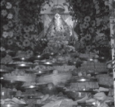
ખેડબ્રહ્મા શહેરમાં અંધિકા માતાજી મંદિર, રાધાકૃષ્ણ મંદિર, નાગભયરી ચામુંડા માતાજી મંદિરમાં કારતક સુદ પૂનમના દિવસે અમ્રકુટ મહોત્સવનું આયોજન કરવામાં આવ્યું હતું. દરેક મંદિરોમાં વિવિધ વાનગીઓ, ફરસાણ, દૂધપાક, બાસુદી, માખણ મીસરી વિગેરેના છપ્પન ભોગ અમ્રકુટમાં ધરાવવામાં આવ્યા હતા.