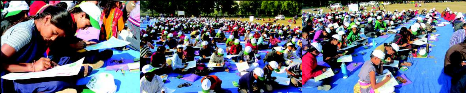
કલ્પનાની રંગપૂલિ : ગાંધીનગર રોટરી ક્લબ, કલવ, જેસીઆઈ અને લલિતકલા અકાદમીના સંયુક્ત સહયોગથી યોજાયેલ બાલવિન સ્પર્ધાને પ્રયંત પ્રતિસાદ પ્રાપ્ત થયો હતો... વહેલી સવારે ૧૮૦૦ બાજુ સ્પર્ધામાં ભાગ લેવા ટાઉનહોલની હોનમાં ઉમટયા હતા. મેળા જેવા માહોલમાં બાળકોએ સુંદર મજાના ચિત્રો દોરી અને પોતાની કલ્પનાને કાગળમાં કંડારી હતી. રંગબેરંગી વાતાવરણમાં બાળકોની કલ્પના શક્તિને વિકાસવાવાના આ પ્રશંસનીય પ્રયાસ સલામને પાત છે... નગરની સ્વેચ્છિક અને સેવાભાવી સંસ્થાઓ દ્વારા બાળકોની આંતરિક શક્તિના વિકાસ માટે યોજાયેલો આ અભિનવ કાર્યક્રમ નગરજનોએ હર્ષભેર વધાવી લીધો હતો...