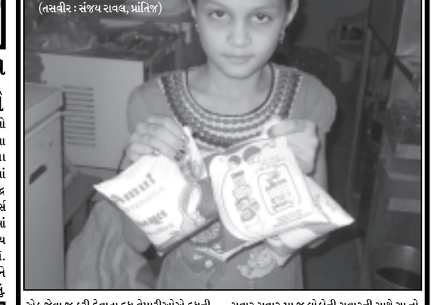
એક જેવા જ કરી દેવાતા દૂધ વેપારીઓએ દૂધની બદલીમાં છાશ અને છાશની બદલીમાં દૂધ આપી દેતા લોકોની ચા નો સ્વાદ બગડી ગયો હતો જેથી વેપારી અને ગ્રાહકો વચ્ચે તુ તુ મે મે થવા પામી હતી. પ્રામ માહિતી અનુસાર ગુજરાત સિલ્ક માર્કેટિંગ ફેડરેશન અને સાબરકાંઠા દૂધ અને છાશના ૫૦૦ ગ્રામના પાઉચના કલરમાં અચાક જ ફેરફાર કરવામાં આવ્યો છે. જેથી પ્રાંતિજમાં જુદા જુદા પેકીંગ અને સવાર સવાર મા જ લોકોની સવારની સાથે ચા નો સ્વાદ પણ બગડી ગયો હતો. સવારમાં જ થેલીઓ બદલાવા માટે પણ ભારે ચાલવપલવ જોવા મળી હતી. દૂધ અને છાશના પાઉચના કલર બદલવાની સાથે છાશના પાઉચમાં પણ ૫૦ પેસાનો વધારો કરી દેવા પહેલા ૩.૮માં છાશની થેલી મળતી હતી જેનું વેચાણ ૩.૧૦માં થતું હતું. જ્યારે હવેની નવી થેલી ૩.૮.૫૦માં મળશે. જેનું વેચાણ ૩.૧૨માં વેચાય છે.

પ્રાંતિજ, તા. ૨૪ ક્લર વાદળી હતો જે અત્યારે આબેહુ દૂધના કલર જેવું જ બનાવવામાં આવ્યું છે. પરિણામે દૂધ-છાશના વિકેતાઓએ ગ્રાહકોને કઈ પણ જોયા વગર જ દૂધના બદલે ભૂલથી છાશના પાઉચ (થેલી) પધરાવી દેતા