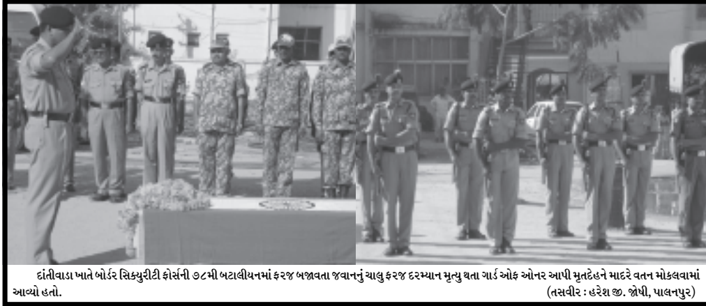
દાંતીવાડા ખાતે બોર્ડર સિક્યુરિટી ફોર્સની ૭૮મી બટાલીયનમાં ફરજ બજાવતા જવાનનું ચાલુ ફરજ દરમિયાન મૃત્યુ થતા ગાર્ડ ઓફ ઓનર આપી મુનદંહને માદરે વતન મોકલવામાં આવ્યો હતો.