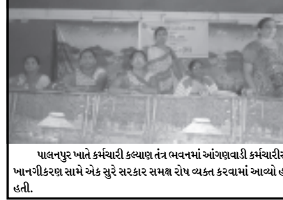
પાલનપુર ખાતે કર્મચારી કલ્યાણ તંત્ર ભવનમાં આંગણવાડી કર્મચારીસભા ગુજરાતનું સ્નેહમિલન સંમેલન યોજવામાં આવ્યું હતું. જેમાં આંગણવાડીના ખાનગીકરણ સામે એક સુરે સરકાર સમક્ષ રોષ વ્યક્ત કરવામાં આવ્યો હતો. આ પ્રસંગે મોટી સંખ્યામાં જિલ્લાની આંગણવાડી બહેનો ઉપસ્થિત રહી હતી.

તબીબો વિના મુલ્યે સારવાર આપે તેવી વ્યવસ્થા અંબાણી પરિવાર તરફથી ઉભી થનાર છે. આ ઉપરાંત શિક્ષણ ભેતે અહીં વેબ ડિઝાઈનિંગ કોમ્પ્યુટર કોર્સ માટે પણ વિચારણા વ્યક્ત કરી હતી. સાથે સાથે બેરા રોડથી ગાર્ડન સુધીનો રસ્તો પૂર્ણ કરવાનું પણ કહ્યું હતું.