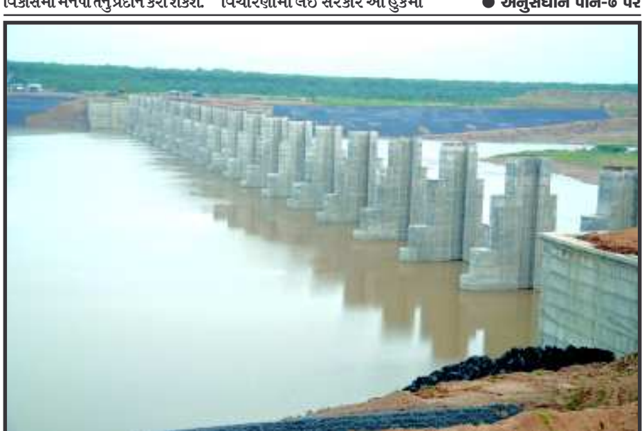
સંતસરોવર છલકાયું - ગાંધીનગર શહેરનો મહત્વકાંક્ષી પ્રોજેક્ટ સંત સરોવરનું સ્વપ્ન સાકાર થયું... ગાંધીનગર માટે ખુશ ખબર છે... પાટરમાં સાબરના પટમાં નિર્માણ પામેલ સંતસરોવર આજે છલોછલ ભરાતા આનંદ અને ઉલ્લાસની લાગણી પ્રસરી હતી...

પાકિસ્તાની વડાપ્રધાન નવાઝ શરીફ ઘરઆંગણે વિપક્ષી આક્રમણથી ઘેરાયેલા છે અને સરહદ પર ચારંવાર યુદ્ધવિરામ ભંગથી ભારત સતત તકડાવી રહ્યું છે ત્યારે શરીફે ભારત સાથેના સંબંધો મીઠા બનાવવાના વધુ એક પ્રયાસના ભાગરૂપે વડાપ્રધાન નરેન્દ્ર મોદીને 'કેરી' મોકલાવી છે. પાક રાજદુતની અલગતાવાદીઓ સાથેની બેઠકથી નારાજ ભારતે પાક સાથે સચીવ સ્તરીય મંત્રણા રદી કરી નાખી હતી. હવે સંબંધો ફરી સામાન્ય બનાવવા અને ભારતનો ગુસ્સો શાંત પાડવા માટે શરીફે ભારતીય વડાપ્રધાન નરેન્દ્ર મોદીને પાકની વિખ્યાત સિંદરી અને ચૌસા કેરીની પેટી મોકલી છે. સામાન વિના મુસાફરી કરતા મુસાફરોને 'કેશ ડિસ્કાઉન્ટ' અપાશે