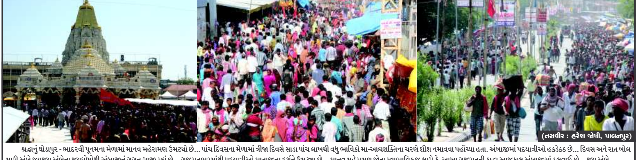
શ્રદ્ધાનું ઘોડાપુર - ભાદરવી પૂનમના મેળામાં માનવ મહેરામણ ઉમટ્યો છે... પાંચ દિવસના મેળામાં ત્રીજા દિવસે સાડા પાંચ લાખથી વધુ ભાવિકો મા-આઘશક્તિના ચરણે શીશ નમાવવા પહોંચ્યા હતા. અંબાજીમાં પદયાત્રીઓ હકડેહક છે... દિવસ અને રાત બોલ મારી અંબે જયજય અંબેના જયઘોષથી અંબાજીનું ગગન ગાઝ રહ્યું છે... ગુજરાતભરમાંથી પદયાત્રીઓ માતાજીના દર્શને ઉમટ્યા છે... માનવ મહેરામણ જોતા સ્વાભાવિક જ લાગે કે, આખા ગુજરાતની શ્રદ્ધા આજકાલ અંબાજીમાં ઠલવાઈ છે... જય અંબે...