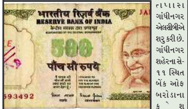
ગાંધીનગર એલસીબીએ શરુ કરી છે. ગાંધીનગર શહેરના સે-૧૧ સ્થિત બેંક ઓફ બરોડાના કૅશ

દેશમાં નકલી ચલણી નોટો ઘુસારીને અર્થતંત્રને અસર કરવાનું કાવતરું ખુબ મોટા પાયે ચાલી રહ્યું છે ત્યારે હવે નકલી ચલણી નોટો છેક ગાંધીનગર સુધી મોટા પાયે આવવા લાગી હોય તેમ લાગી રહ્યું છે. છેલ્લા પાંચ મહિનામાં ગાંધીનગરની એક જ બેંકમાં વિવિધ દરની ૩૯ નકલી ચલણી નોટ જમા થઈ હોવાનું ધ્યાને આવ્યું છે. તે સિવાય હરતી ફરતી અન્ય બેંકોમાં જમા થઈ હોય તે અલગ...! સે-૧૧માં સ્થિત બેંક ઓફ બરોડામાં ૩૯ નકલી નોટો આવી હોવાની ફરિયાદ કેશ ઓફીસરે નોંધાવી છે. જેની