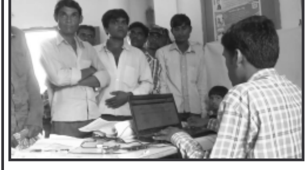
આધારકાર્ડ ફરજિયાત કરવામાં આવ્યું છે. આ એક પુરાવો છે. જે પુરાવો ભારતના આમ આદમીને દરેક જગ્યાએ ઓળખ સ્વરૂપે કામ લાગવાનો છે. આ કાર્ડ માટે મોડાસામાં એક ખાનગી એજન્સીને કામ સોંપવામાં આવ્યું છે. જે એજન્સી મોડાસા તાલુકામાં માથાસુલીયા અને અણદાપુર ગામે સેન્ટર ઉભું કર્યું છે અને લોકોને આધારકાર્ડ ઈસ્યુ કરવા માટે ગરીબ જનતા પાસેથી એક આધારકાર્ડ ઈઈ રૂ ૧૦ ખંબેરવામાં આવી રહ્યા છે. જેનાથી આ કાર્ડ લેવા આવતા લોકો ધકકે ચડી ગયા છે સાથે લોકો ધ્વારા એવુ પણ જણાવામાં આવી રહ્યું છે કે સરકાર તરફથી મફતમાં કાર્ડ આપવાની મોટી મોટી જાહેરાતો કરવામાં આવી રહી છે. તેમ છતાં આ એજન્સી ધ્વારા પૈસા કેમ લેવામાં આવે છે? અને કોઈક કોઈક વાર તો ૧૦ રૂ નહી પણ આમનુ મન ફાવે તો ૫૦ રૂપીયા પણ લઈ લેવામાં આવે છે અને જે લોકો પૈસા આપે તેમના જ આધારકાર્ડ કાઢવા માં આવે છે. અણદાપુર ની આંગણવાડી માં ખોલવામાં આવેલ આધારકાર્ડ સેન્ટરમાં આ આધારકાર્ડ કાઢવા માટે એજન્સી ના કર્મચારીઓ ધ્વારા મોટાપાયે ગેરરીતી આચરતા નુ પ્રકાશ માં

લોકો મેળવી શકશે. પરંતુ આ બે ગામના લોકો ને એટલી પણ ખબર નથી કે સરકાર ધ્વારા આ કાર્ડ મફત કાઢી આપવામાં આવે છે. પરંતુ તે કાર્ડ લોકો ને એજન્સી ધ્વારા મફત નહી પણ રૂ ૧૦ લઈ ને કાઢી આપવામાં આવે છે. આ વિસ્તાર ના ગરીબ લોકો આધારકાર્ડ કઢાવવા માટે પોતાને ખાવાનું અનાજ વેચી ને એજન્સી ને આધારકાર્ડ કઢાવવા પૈસા આપે છે. આ અણદાપુર ગામ ની ગરીબ અને અભણ પ્રજા પાસે થી આધારકાર્ડ