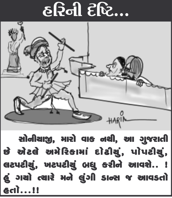
સોનીચાણ, મારો વાક નથી, આ ગુજરાતી છે એટલે અમેરિકામાં દોઢીચું, પોપટીચું, લટપટીચું, ખટપટીચું બધું કરીને આવશે.. ! હું ગયો ત્યારે મને લુંગી ડાન્સ જ આવડતો હતો...!!

સેક્ટર-૨ ર સ્થિત આર.જી. પટેલ અને એસ.બી. પટેલ હાયર સેકન્ડરી સ્કૂલમાં સ્વચ્છ ભારત સમાહ અંતર્ગત સફાઈ અભિયાન હાથ ધરવામાં આવી હતી. શાળામાં આચાર્ય ઓફિસ, વિવિધ લેબ, ગ્રંથાલય, વર્ગ ખંડો તેમજ સંડાસ, બાથરૂમ, એસી., પંખા, સહિત ખૂણે ખૂણાની સાફ સફાઈ કરવામાં આવી હતી.