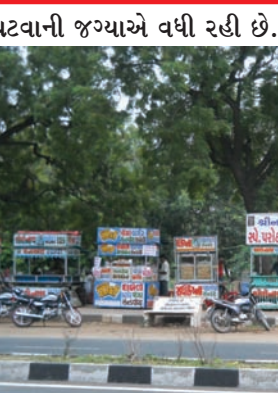
ઘટવાની જગ્યાએ વધી રહી છે. પગલા લેવામાં આવી રહ્યા છે. પરંતુ

કોઈ મોટો રોગચાળો ફાટી નીકળે તેની રાહ જોત હોય તેમ લાગી રહ્યું છે. નગરમાં ધમધમી રહેલા ખાણીપીણી બજાર સહિત લારી ગલ્લા પર તંત્ર ત્રાટકી ખાવા લાયક ન હોય તેવો ખોરાક નષ્ટ કરી વેપારીઓ પર કાયદેસરની કાર્યવાહી કરવામાં આવે તેમ શહેરીજનો ઈચ્છી રહ્યા છે.