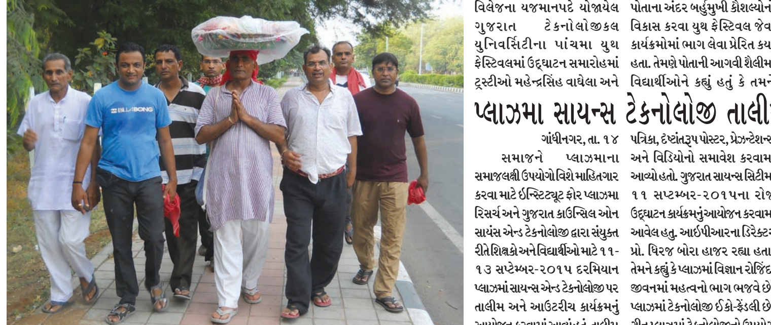
ભાદરવો માસ શરૂ થતાં "અંબાજી પગપાળા" સંઘની શરૂઆત થઈ ગઈ છે. અમદાવાદથી દૂધવાળી પાંખ અંબાજી પગપાળા સંઘ ૨૪માં વર્ષે ભાવન ગજની ધજા લઈને રવિવારે ૧૫ મીની સવારે પ્રસ્થાન કરી અંબાજી ખાતે ૨૧ સપ્ટેમ્બરે પહોંચશે. આ સંઘમાં લગભગ ૧૦૦ જેટલા પદયાત્રીઓ જોડાયા છે. ગાંધીનગરના ધ માર્ગ પરથી સવારે "બોલ મારી અંબે"ના નારા ગુંજી ઉઠવા હતા.

ગાંધીનગર, તા. ૧૪ ગુજરાત માધ્યમિક અને ઉચ્ચતર માધ્યમિક શિક્ષણ બોર્ડ, ગાંધીનગર દ્વારા લેવાનારી ધો. ૧૨ વિજ્ઞાનપ્રવાહના પ્રથમ અને ત્રીજા સેમેસ્ટરની પરીક્ષાનો કાર્યક્રમ જાહેર કરવામાં આવ્યો છે. આગામી તા. ૨થી ૮ નવેમ્બર દરમિયાન આ પરીક્ષાઓ યોજાશે. ધનતેરસે પણ વિદ્યાર્થીઓએ પરીક્ષા આપવી પડશે. ધો. ૧૨ વિજ્ઞાન પ્રવાહના પ્રથમ અને ત્રીજા સેમેસ્ટરની બધા વિષયોની પરીક્ષા ઓએમઆર પદ્ધતિથી લેવામાં આવશે. પ્રથમ સેમેસ્ટરની પરીક્ષામાં તા. ૨જી નવેમ્બરે જીવવિજ્ઞાન, ઉજીએ અંગ્રેજી, ૪થીએ ગુજરાતી/સંસ્કૃત/કોમ્પ્યુટર, ૫મીએ ગણિત, ૭મીએ ભૌતિક વિજ્ઞાન અને ૮મીએ રસાયણ વિજ્ઞાનનું પેપર લેવાશે. ત્રીજા સેમેસ્ટરની પરીક્ષામાં તા. ૨જી નવેમ્બરે ગણિત, ઉજી નવેમ્બરે અંગ્રેજી, ૪થી નવેમ્બરે ગુજરાતી/સંસ્કૃત/ કોમ્પ્યુટર, ૫મીએ જીવવિજ્ઞાન, ૭મીએ રસાયણ વિજ્ઞાન અને ૮મીએ ભૌતિક વિજ્ઞાનની પરીક્ષા યોજાશે. પરીક્ષા સંબંધી માહિતી માટે બોર્ડની વેબસાઈટ www.gseb.org ની મુલાકાત લઈ શકાશે. દિવાળી પહેલાં એક-બે દિવસ અગાઉ જ પરીક્ષાઓ પુર્ણ થશે. છેલ્લુ પેપર છેક ધનતેરસે લેવામાં આવશે. દિવાળી પહેલાં જ પરીક્ષાઓ હોઈ વિદ્યાર્થીઓ અને તેમના વાલીઓ દિવાળીની તૈયારીઓના બદલે પરીક્ષાની તૈયારીમાં વ્યસ્ત રહેશે. ઓક્ટોબર માસમાં પ્રાયોગિક પરીક્ષાઓ શાળા દ્વારા યોજાશે.